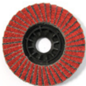
FORMA PIANA - FLAT SHAPE

- CERAMIC (K) + ZIRCONIUM: For use on inox steel, tempered steel, cast iron, alloys and titanium.