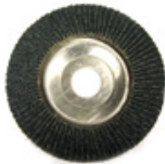
FORMA CONICA - CONICAL SHAPE