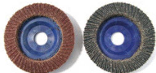
FORMA PIANA - FLAT SHAPE