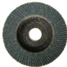
FORMA CONICA - CONICAL SHAPE