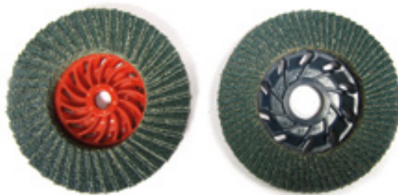
FORMA PIANA - FLAT SHAPE

- ALUMINIUM OXIDE: suitable for iron, plastic, paints, resins and non-ferrous materials.